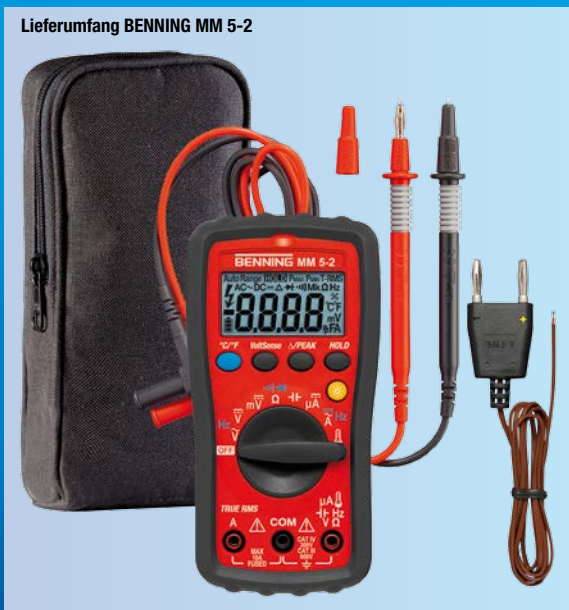
Lieferumfang BENNING MM 5-2