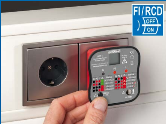
Test van de uitschakelfunctie van 30 mA RCD-zekering door het indrukken van de FI/RCD-knop.