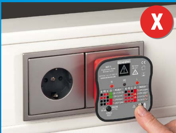
Stekkerdoos met bekabelingsfout, levensgevaar! Buitenkabel (L) en randaarde (PE) werden omgewisseld!