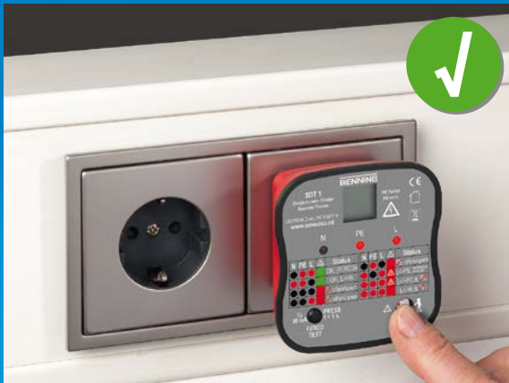
Stekkerdoos correct gemonteerd, vingercontact controleert het PE-contact op gevaarlijke aanraakspanning.