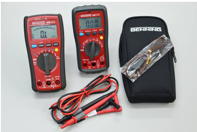
BENNING MM 6-2 und MM 5-2* (*mit Zubehör)

Mit der neuen TRUE RMS Digital-Multimeter-Serie MM 5-1/-2 und MM 6-1/-2 bringt BENNING vier robuste Messgeräte auf den Markt, die sich durch das Echteffektivwert-Messverfahren nicht nur für den Einsatz im industriellen Bereich eignen, sondern darüber hinaus noch einige zusätzliche, besonders nützliche Funktionen bieten.