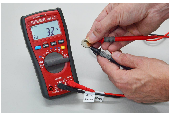
LoZ-Spannungsmessung an einer Stützbatterie

Zur Unterdrückung von Blindspannungen verfügt das BENNING MM 6-1 über eine spezielle LoZ-Funktion mit automatischer AC/DC-Erkennung. In dieser Messposition wird die Eingangsimpedanz von 10\ \text{M}\Omega auf 3\ \text{k}\Omega reduziert.