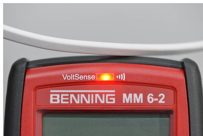
Detektion spannungsführender Leitungen

Berührungsloser Voltsensor zur Signalisierung netzspannungsführender Leitungen. Stirnseitig im Gehäuse befindet sich eine Sensorik, die Wechselspannungen ( 230\ \text{V} ) bei Annäherung an die Leitung optisch und akustisch signalisiert. Damit lassen sich ebenso Leiterbrüche einfach und schnell finden.