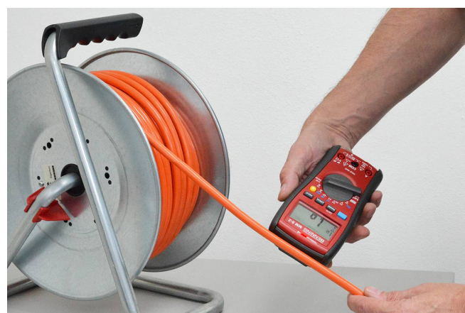
Leitungsunterbrechung an einer Kabeltrommel orten

Beide Modelle verfügen zudem über Diodentest, Durchgangsprüfung, Kapazitätsmessung, Spitzenwertspeicherung, Relativwertfunktion und Data-Hold.