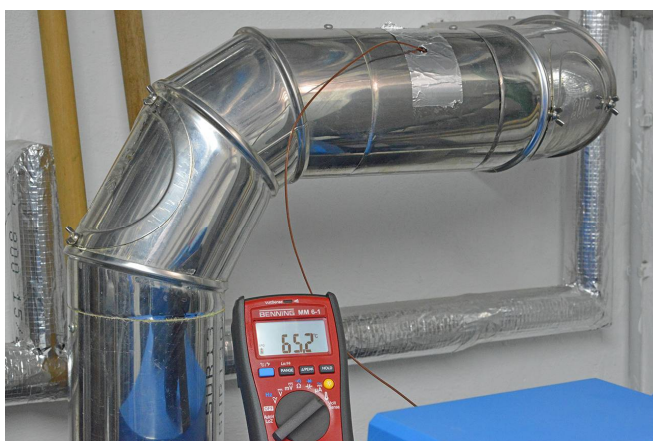
Messung der Abgastemperatur

Temperaturmessungen werden häufig notwendig und sind auch bei der Fehlersuche wichtig, wenn es gilt, die in der Steuerung angezeigten Messwerte auf Plausibilität zu überprüfen. Die Modelle BENNING MM 5-2 und MM 6-1 verfügen hierzu über eine Temperaturmessfunktion und einen reaktions-schnellen Messfühler, womit Temperaturen von -40\text{ °C} bis +400\text{ °C} gemessen werden können. Mit Hilfe der Widerstands-Messfunktion ( 0,1\ \Omega - 40\ \text{M}\Omega ) kann eine sofortige Beurteilung der zu prüfenden Fühler über einen Soll-Ist-Vergleich erfolgen. Eine Nullabgleich-Funktion bietet dabei zusätzliche Genauigkeit bei Messungen niedriger Widerstände.