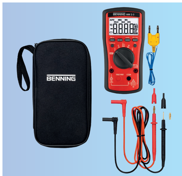
Inhoud MM 2-3