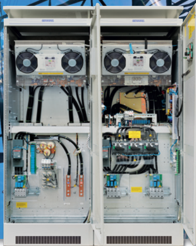
Рис. 7: ИБП серии ENERTRONIC I 120 кВА в шкафу с классом защиты IP21 (опция)