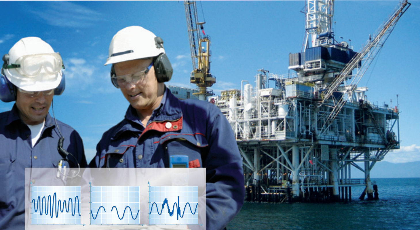
Рис. 1: Возможные сетевые помехи