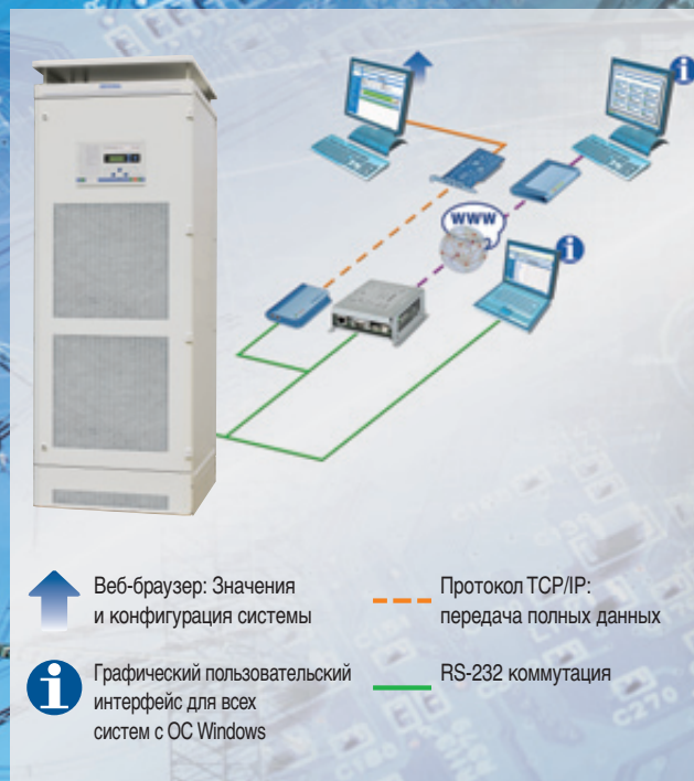
Рис. 5: Расширенные функции текущего контроля и отчетности