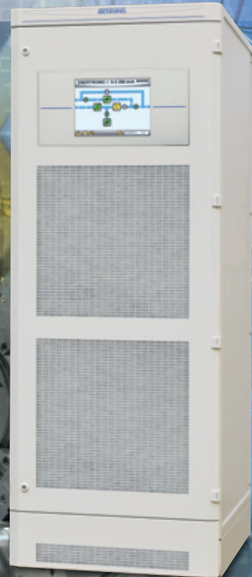
Рис. 3: ИБП серии ENERTRONIC I 40 кВА