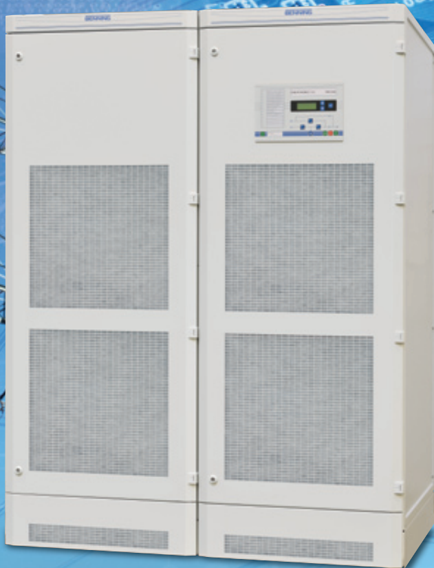
Рис. 4: ИБП серии ENERTRONIC I со стандартным блоком управления