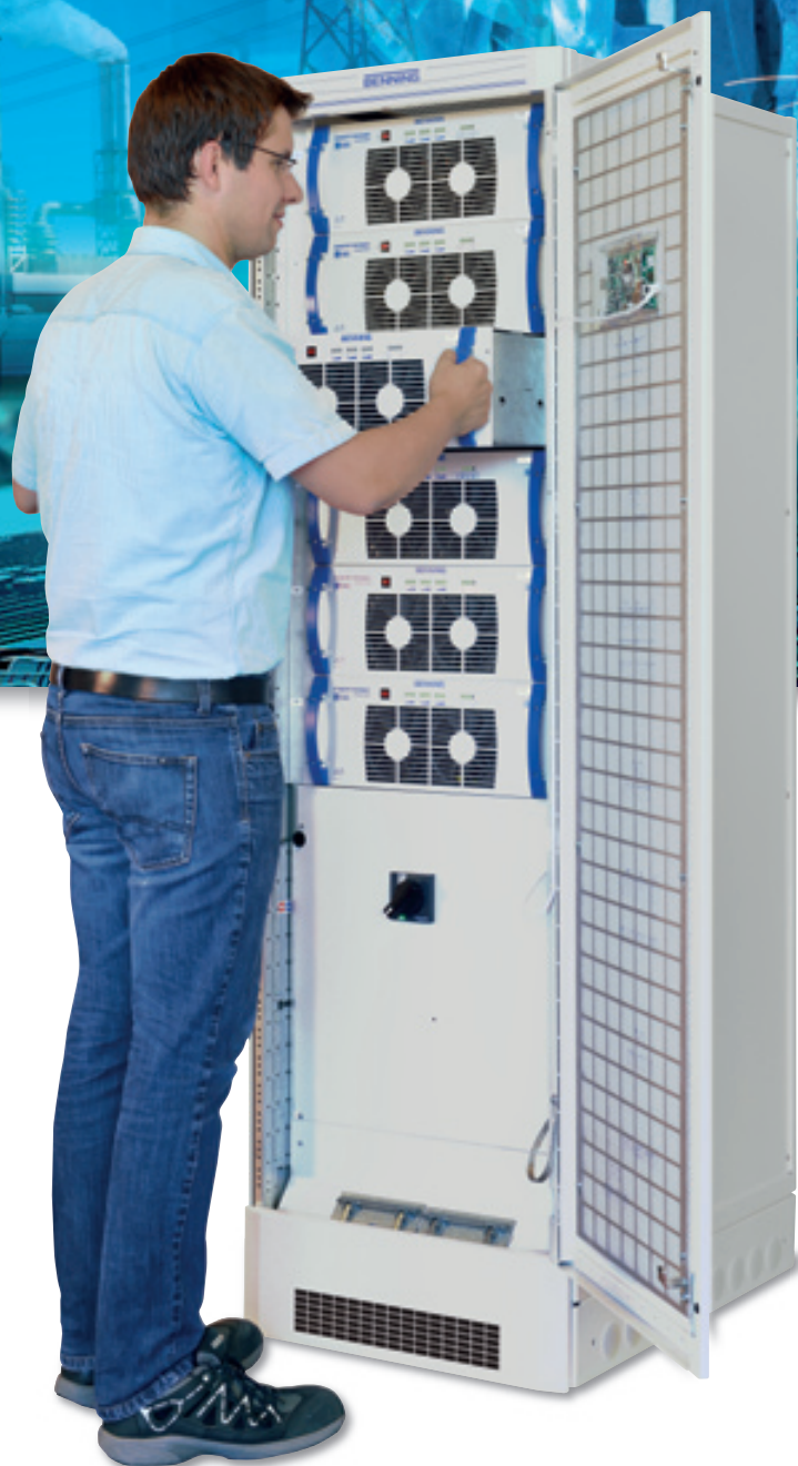
Fig. 3: Semplicità di estrazione dei moduli grazie alla tecnologia "hot plug" e alla configurazione automatica dei moduli.

Non è sempre facile prevedere le dimensioni di un carico critico nel tempo e se un UPS è sovradimensionato o sottodimensionato, si sprecano investimenti preziosi. L'UPS ENERTRONIC modular SE è pensato proprio per ridurre in modo significativo i costi associati al sovradimensionamento o al sottodimensionamento del sistema in fase di progettazione e di realizzazione dell'impianto. In questo modo, solo il numero esatto di moduli necessari per fornire la capacità di sistema richiesta (o ridondanza) sarà installato al "primo giorno" di vita del sistema e quando il carico critico varierà nel tempo, aumentando o diminuendo, i moduli verranno aggiunti o rimossi rapidamente dal sistema, sempre per garantire il corretto dimensionamento per la protezione del carico critico.