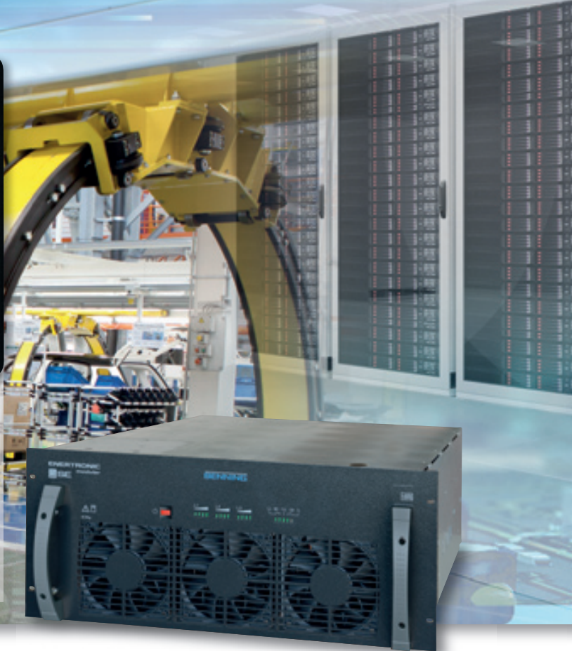
Fig. 6: Moduli da 40 kW di ENERTRONIC modular SE per applicazioni IT

La MCU può essere alloggiata sulla porta dell'armadio dell'UPS. Questa versione comprende uno schermo touch da 10,4". La MCU è disponibile anche come inserto rack da 19" (1U). La parte anteriore del modulo di controllo presenta poi un display da 1,8", un'interfaccia USB 2.0 (per ospitare una chiavetta WLAN, ad esempio) e una porta ethernet.