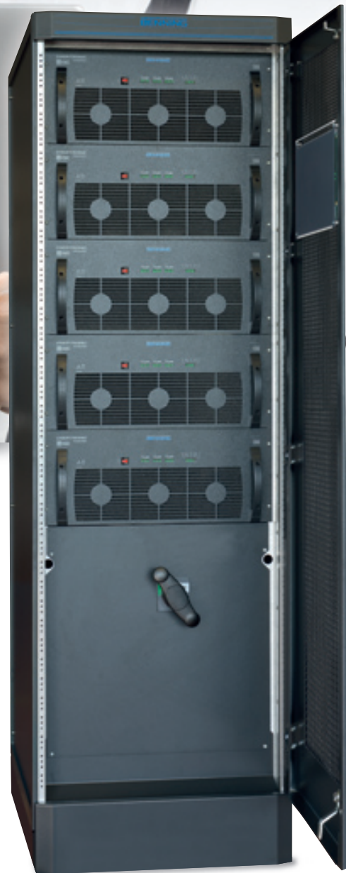
Fig. 8: Versione IT di ENERTRONIC modular SE