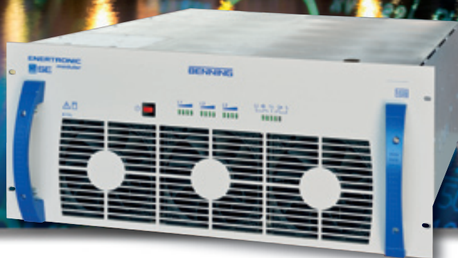
Fig. 1: Modulo da 40 kW di ENERTRONIC modular SE