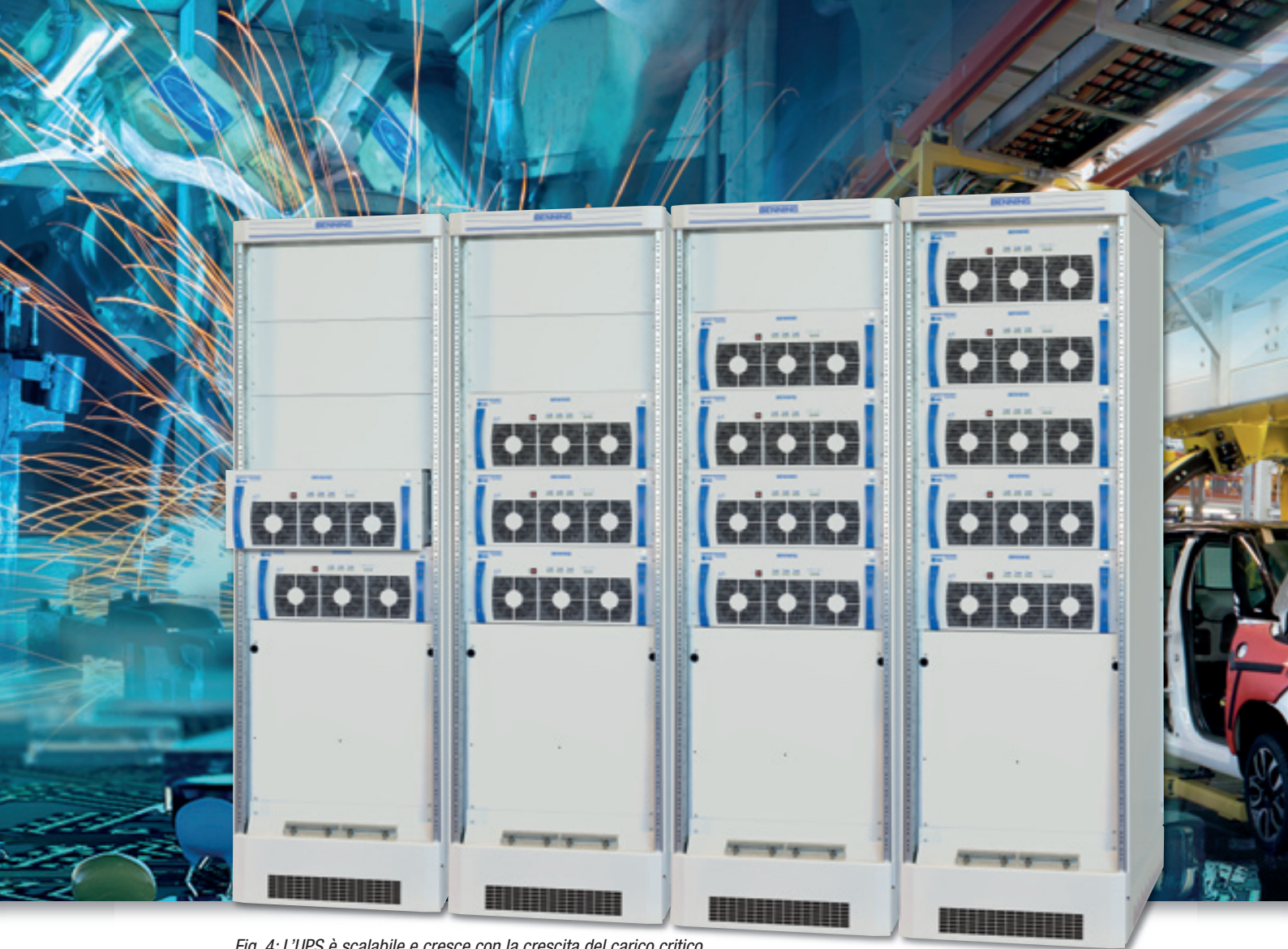
Fig. 4: L'UPS è scalabile e cresce con la crescita del carico critico