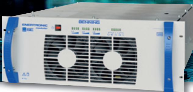
Fig. 2: Modulo da 20 kW di ENERTRONIC modular SE