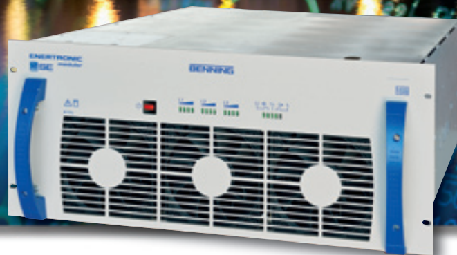
Рис. 1: ИБП ENERTRONIC modular SE, модуль 40 кВт