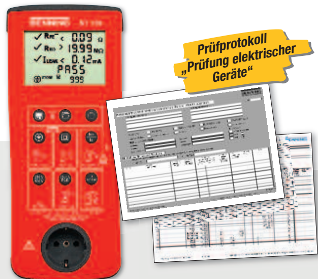
BENNING ST 725

Gerne erstellen wir Ihnen ihr individuelles Schulungsangebot auch zu anderen BENNING Produkten.