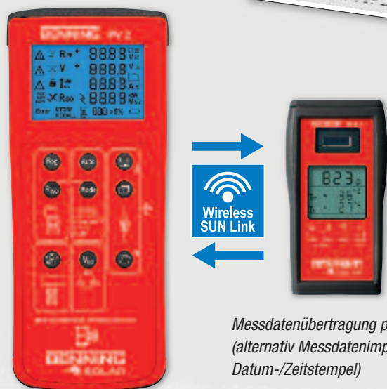
Messdatenübertragung per Funk (alternativ Messdatenimport über Datum-/Zeitstempel)