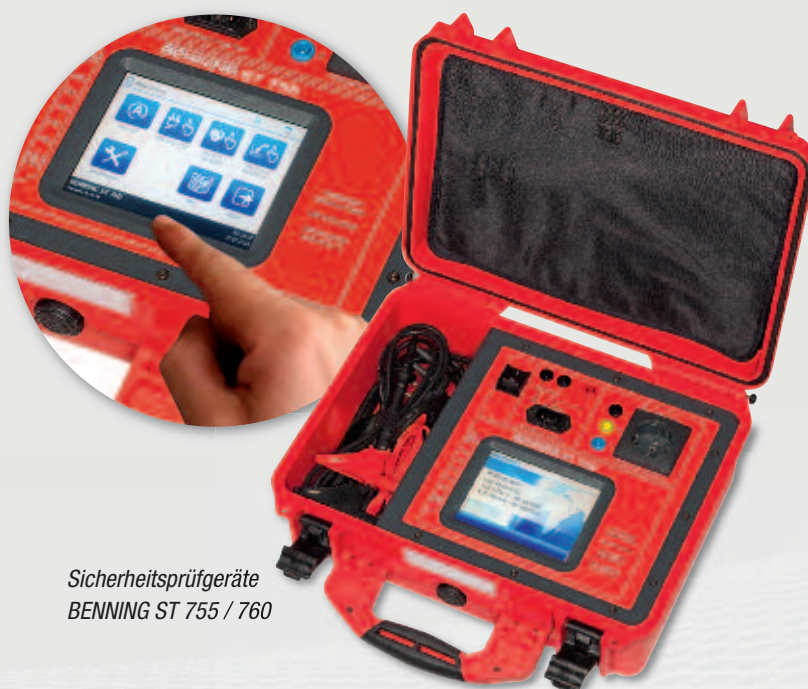
Sicherheitsprüfgeräte BENNING ST 755 / 760