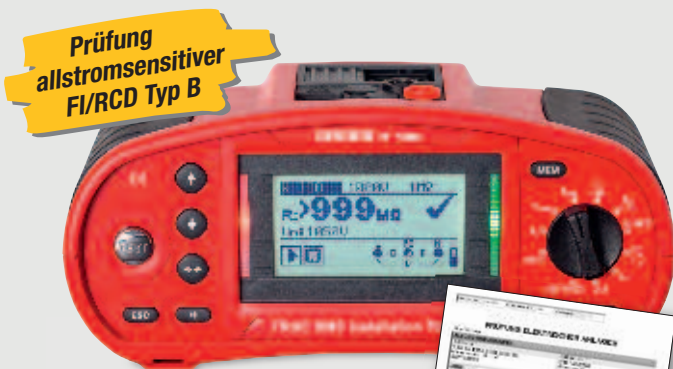
BENNING IT 130 Installationsprüfgerät